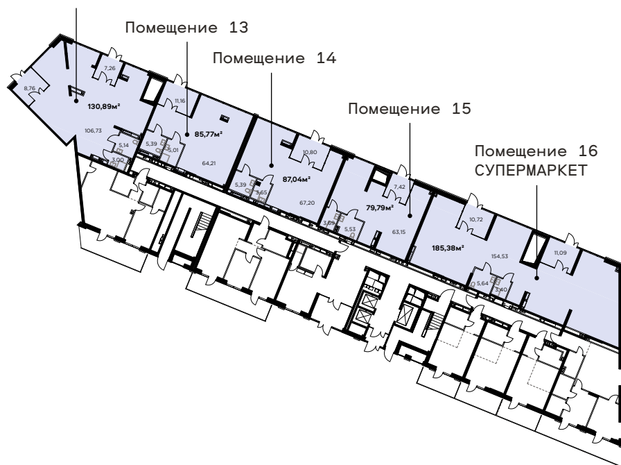
Помещение 12 РЕСТОРАН/ПЕКАРНЯ